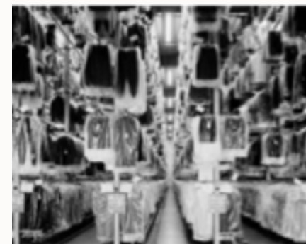
MASKA SCANDIANO (MANCA FOTO)