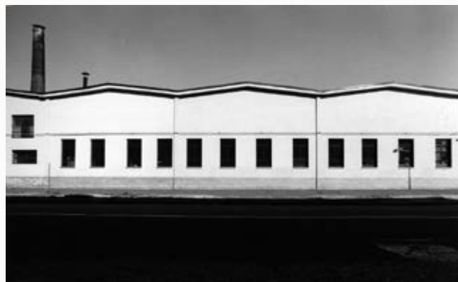
MILANO RITRATTI DI FABBRICHE

Quel giorno di primavera mi aveva rivelato una realtà che non avevo mai visto. Ricordo di essermi chiesto dove fossi e se quel luogo fosse veramente un'area della periferia milanese.